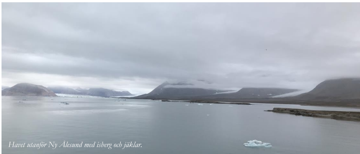
Havet utanför Ny Ålesund med isberg och jäklar.