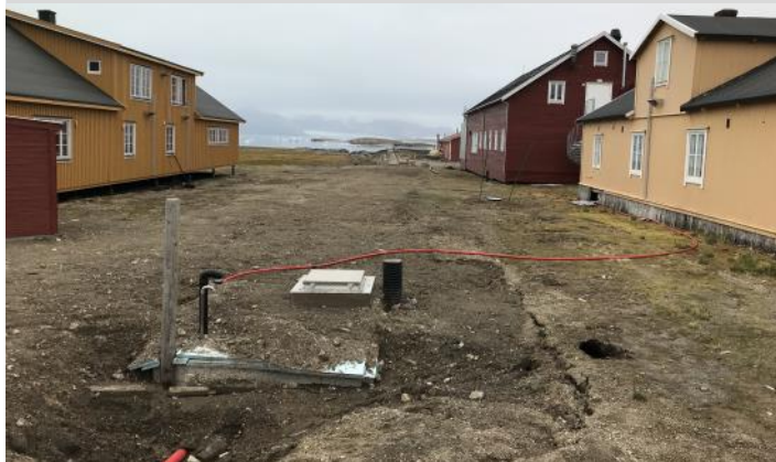
Gatubild i Ny Ålesund