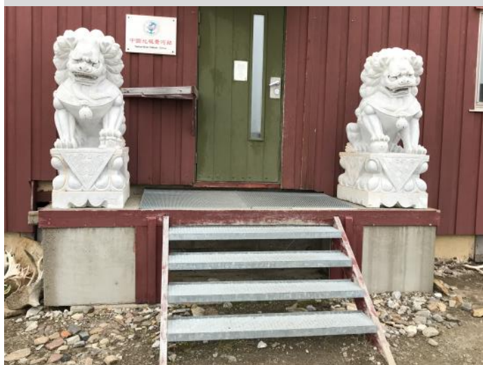
Kinesisk närvaro i Ny Ålesund