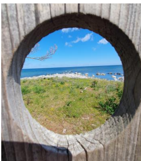
Utkik mot Säludden.