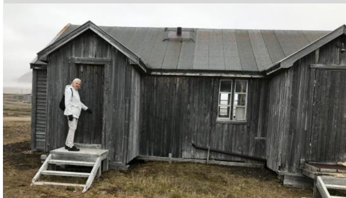
Äldre gruvarbetarbostad i Ny Ålesund