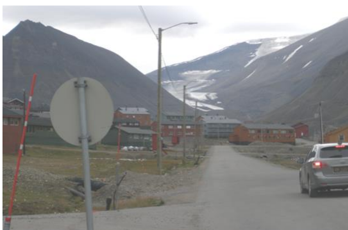
Jöklar sedda från Longyearbyen

Vi lämnade Longyearbyen sent på eftermiddagen, for rakt västerut, rundade ön Prins Karls land och for sedan norrut. Då upptäckte vi de små isbergen. Hela natten for vi norrut och på morgonen låg vi i hamn i Ny Ålesund