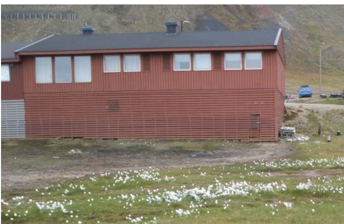
Polarull i Longyearbyen

Hotellet var ett modernt Radisson-hotell och husen i stan var låga, högst tre våningar, och oftast målade i glada färger. Det fanns inga träd, inte ens buskar och inga blommor, enbart en typ av polarull. Solen lyste så starkt att man fick ont i ögonen, trots att klockan närmade sig 20.