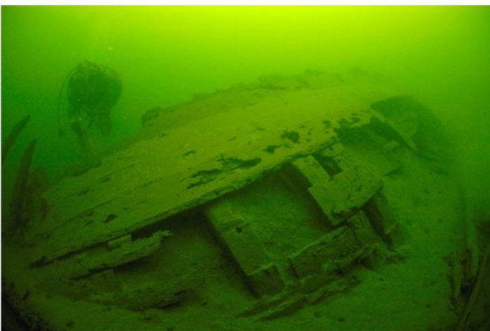
"Kunde vara bild av vraket av Irene, men är det nog inte. I varje fall är bilden tagen i Vänern, någon gång under 1964."