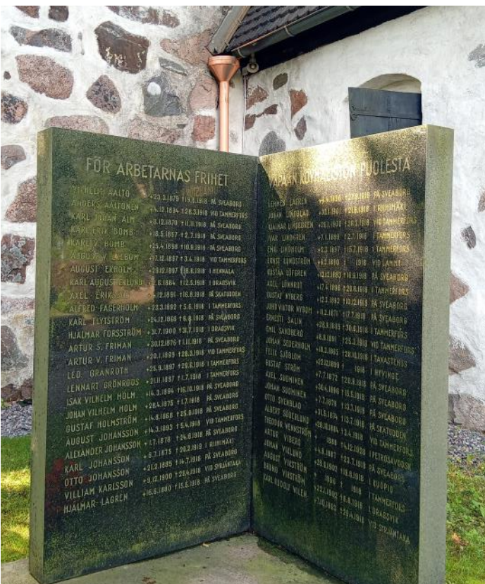
Minnessten över stupade i inbördeskriget vid Tenala kyrka.

Vi färdades genom det sköna sommarlandskapet med dess åkrar, ängar, lövskog, sjöar och vattendrag. Vi fick ta del av gedigna föredrag av entusiastiska personer som renoverar och vårdar byggnader och miljöer så att de kan bli tillgängliga och förmedla den lokala historien till besökare. Först Tenala kyrka med anor från 1400-talet, en annorlunda bild av Nattvarden samt minnesstenar över de många stupade i inbördeskriget och kriget mot Sovjetunionen på 1940-talet.