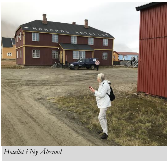
Hotellet i Ny Ålesund