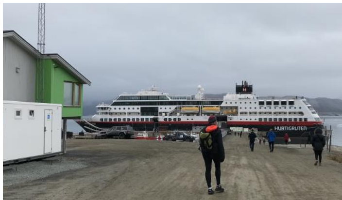
Trollfjord i Ny Ålesunds hamn

Eva och Lars berättar mer om resan efter årsmötet den 25 oktober ( se s.3)