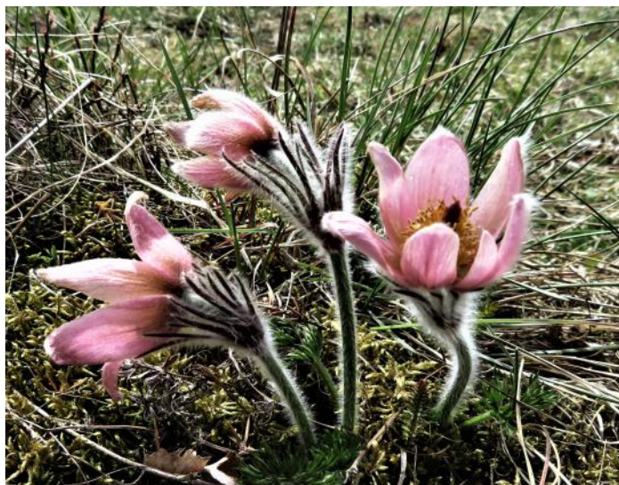
Röda backsippor