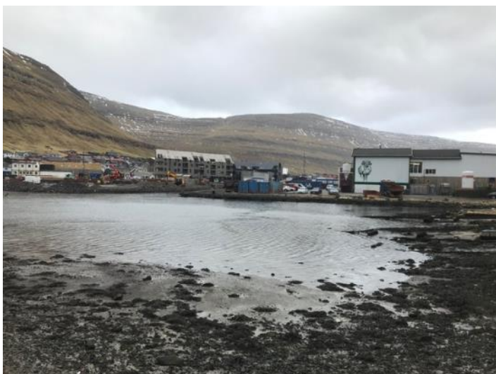
Nytt centrum byggs upp i Klaksvík