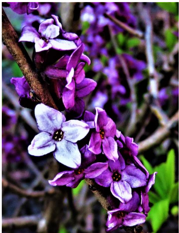
Tibast