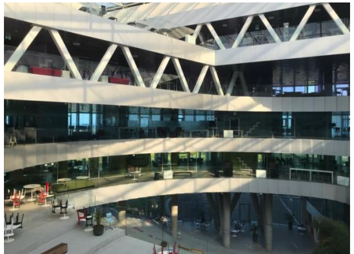
Gymnasieskolan Glasir, Tórshavn.