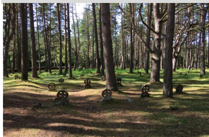
Kyrkogård på Ormsö