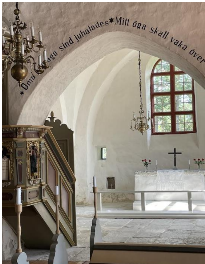
St Olofs kyrka i Ormsö