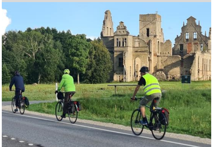
Ruin av Unguru slott mellan Hapsal och Robuküla