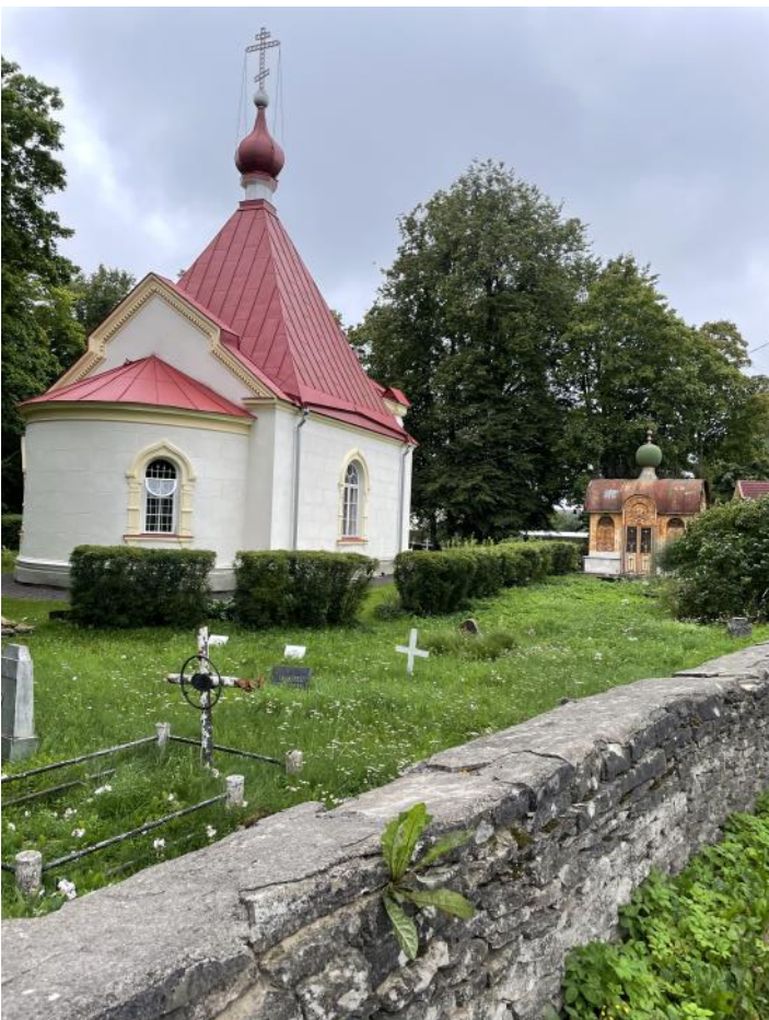
Ortodoxa kyrkan i Hapsal

Frånsett de nämnda komplikationerna flöt allt på mycket bra. Vi hann besöka flera intressanta museer. Förutom Aiboland var vi på Dagö museum, Ilon Wikland-museet i Hapsal, Ormsö hembygdsgrd och St Olavs kyrka på Ormsö, och fick guidning på flera av dem. Dagö museum hade text så gott som enbart på estniska, och detsamma gällde flera informationstavlor vid sevärdheter längs vägen. Vi hann även se några kyrkogårdar – en del med solkors – och begrunda de svenska texterna. Det var sorgligt ofta som skyltarna vid ruiner berättade om förstörelsen under den sovjetiska ockupationen under och efter andra världskriget. Liksom Lettland, där vi cyklat tidigare, drabbades Estland också av deportationer.