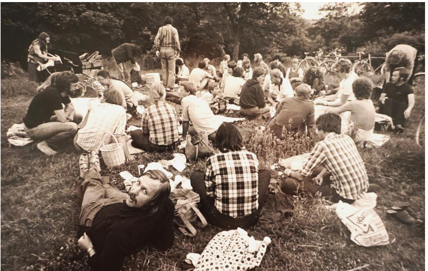
FNSiN-picknick på Långholmen 1970-talet