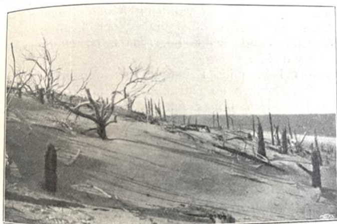
Gotska Sandön: Af sanden dödad skog.

Att avståndet från Bredsands udde till Tärnuddan är 9 km eller att högsta punkten ligger 42 m ö h gäller ju fortfarande, men att Sveriges kanske största hassel finns (eller åtminstone fanns) nära Bredsand var nytt för mig. Där hänvisas till Svenska Naturskyddsförningens årskrift 1911 sid 93, men den har jag inte så jag vet inte närmare var den skulle ha funnits.