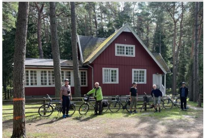
Ormsö, Elle-Malls pensionat.