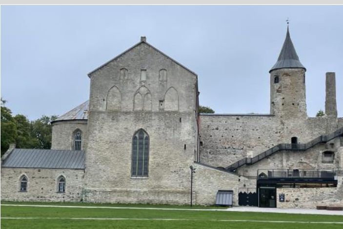
Biskopsborgen i Hapsal