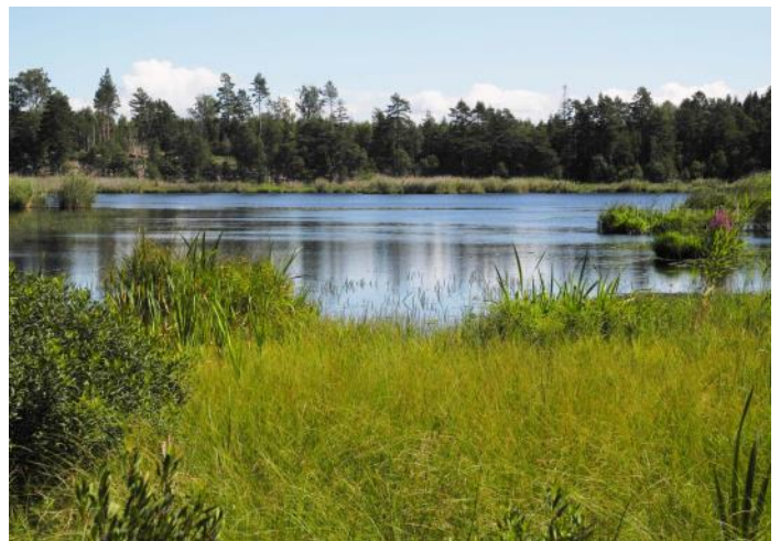
Sjön Flarken på Klyftamon inom Holmestads socken, Västergötland.

Sjön Flarken hade också blivit aktuell kring 1975 då kvartärgeologiska institutionen vid Lunds universitet undersökte den genom att borra i dess avlagringar. Det var nämligen så, att denna lilla sjö var den enda forskarna hittade i området som inte innehöll kalk. Kalk gjorde det omöjligt att datera pollen i en sjös lager. Och det var pollen som var det intressanta i den flandriska vegetationshistoria som skulle undersökas (se Digerfeldt 1977 nedan). Flandrian i rapportens titel, alltså "flandrisk," betyder holocen eller postglacial, alltså efter istiden (Nilsson 1972: 23). Numera talar man om att vi inträtt i en annan tidsålder, antropocen . Det är faktiskt ett begrepp som infördes redan av sovjetiska forskare. Nu är det som bekant tämligen allmänt.