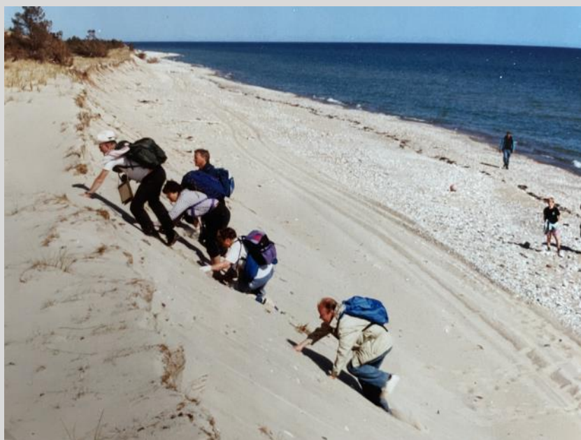
I lösan sand.

Hör av dig till camillaberg8888@gmail.com