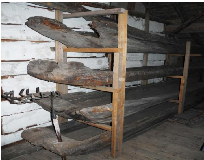
Stockbåtarna från Flarken i Vättilösa hembygdsmuseum på gamla prästgårdens vind.

furu och detta har kommit från mycket stora träd. Fynden bör ha upptäckts senast 1926 då den kända sjösänkningen ägde rum. Troligen tillhör de flesta 1600-talets slut, att döma av de kommande uppgifterna ur domboken. Det blir inte mindre troligt med tanke på att koloniseringen av allmänningskogen Klyftamon tycks härröra från nyare historisk tid, alltså efter den egentliga medeltiden.