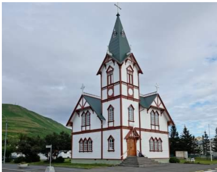
Kyrkan i Húsavík

Staden har också ett modernt havsbad, Geosea, som är uppvärmt geotermiskt. Det var en fantastisk upplevelse