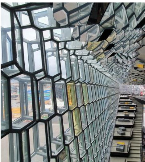
Fönsterprismorna i Harpa inifrån