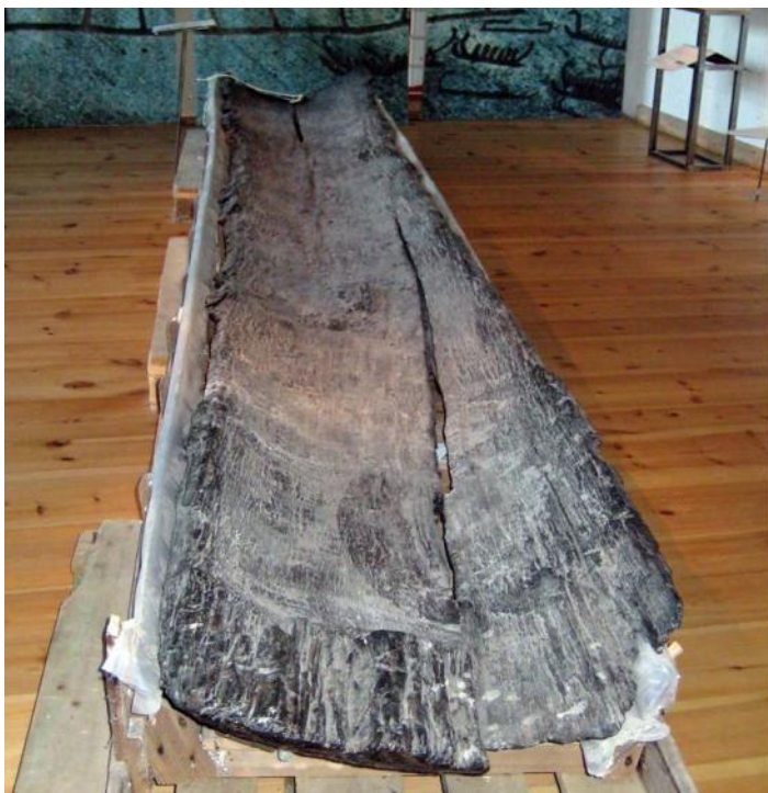
Sveriges f.n. äldsta stockbåt, från Marbogårdens mark i Strö, Kålland, daterad till bronsålder, ca 1000 f.Kr.

Det äldsta fyndet i Norden är från Kuusamo i Finland och är cirka 7000 år gammalt. Den farkosten var för övrigt försedd med uttriggare. I övrigt är fynden betydligt yngre i motsats till Danmark och kontinenten. Den äldsta båten i Sverige är västgötsk, från bronsålder cirka 1000 f.Kr. och blev funnen på Marbogårdens mark i Strö, Kålland. I samma socken har gjorts flera fynd, som på Persgårdens mark, daterad 1000 e.Kr., alltså med en spännvidd på 2000 år. Båda fyndplatserna har anknytning till Vänerns inre delar. Ett ovanligt stort och välbevarat stockbåtsfynd förvarat i magasin blev senare funnet i Fiskeby i Hälsingland och visade sig vid undersökning vara från 700-talet f.Kr. (Ulthielm 2007).