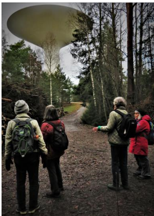
Vattentornet på Lidingö.