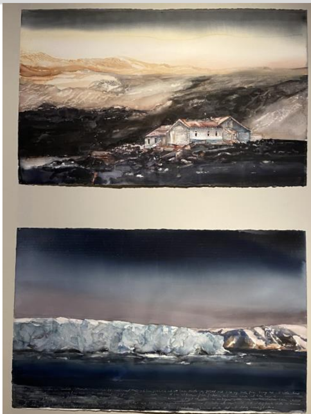
Akvareller av Lars Lerin på Waldemarsudde.