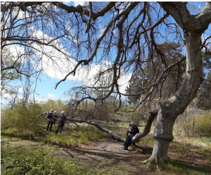
Hängboken vid Ljunglöfs slott.