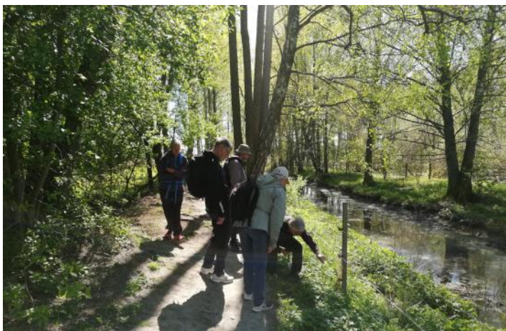
I Sandemar vid diket som leder mot havet.