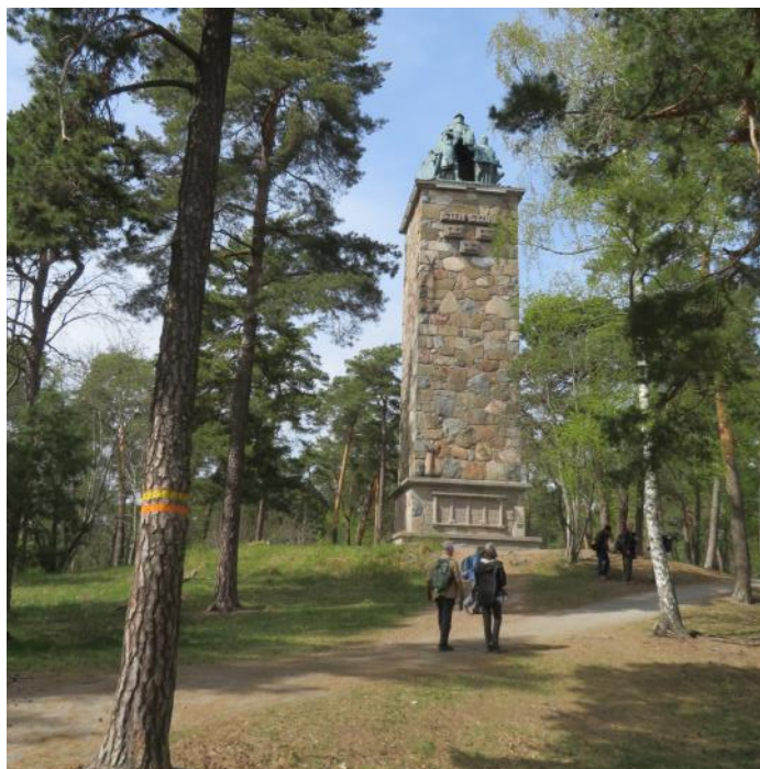
Sten Sture -monumentet .