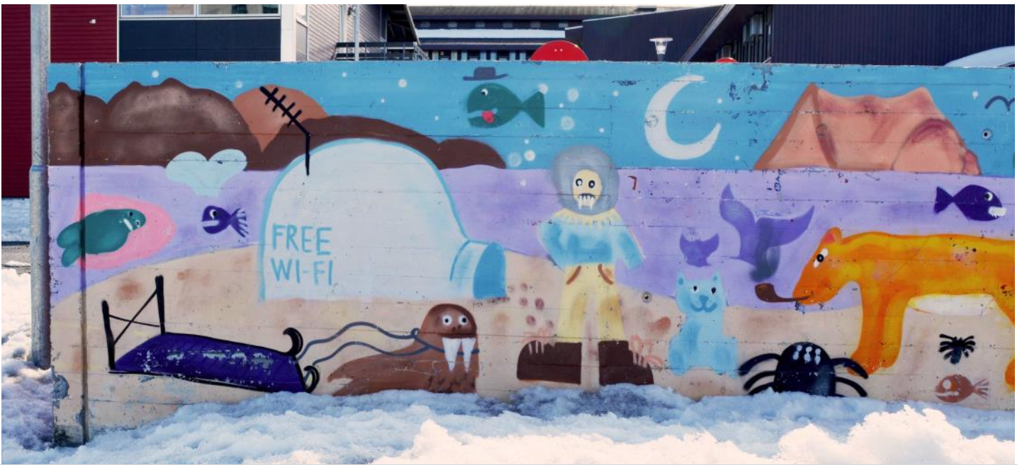
Grönländsk gatukonst med aktuellt budskap.

Genom fältarbetet kom det fram hur människor strukturerade sina liv för att få tillgång till gratis Wi-Fi utan att behöva betala för dyra mobila data. Deltagare nämnde hur de kunde planera sin dag med tanke på förväntade perioder av nedkoppling och alltså levde med upprepade växlingar mellan digital isolering och digital uppkoppling. Som en deltagare anmärkte: ”Jag springer hem, för där jag har Wi-Fi, eftersom folk kanske väntar på beslut från mig [om något arbetsrelaterat projekt]”. På så sätt blev det lokala biblioteket, som var det enda stället i Nuuk med gratis Wi-Fi, en mötesplats för dem som sökte uppkoppling. Också efter öppettiderna hängde folk längs bibliotekets ytterväggar för att komma åt det Wi-Fi som fanns gratis där innanför. Deltagare pratade om den frustration som de kunde känna, då till synes vardagliga rutiner för att komma åt information och att samverka med andra via digitala medel hämmades av dålig infrastruktur och höga kostnader.