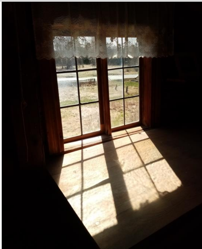
Fönster i Pallars gård.