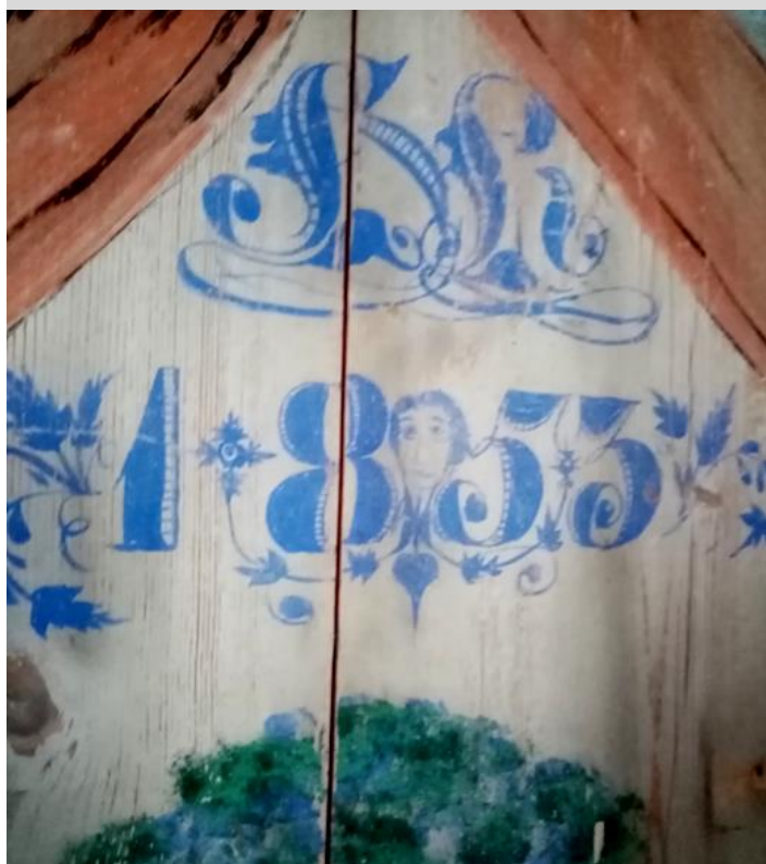
Målarens ansikte ritat i årtalet.

Tips från redaktionen: Läs gärna också 'Bland bruk och anor i Hälsingland, NOS nr 2/ 2015