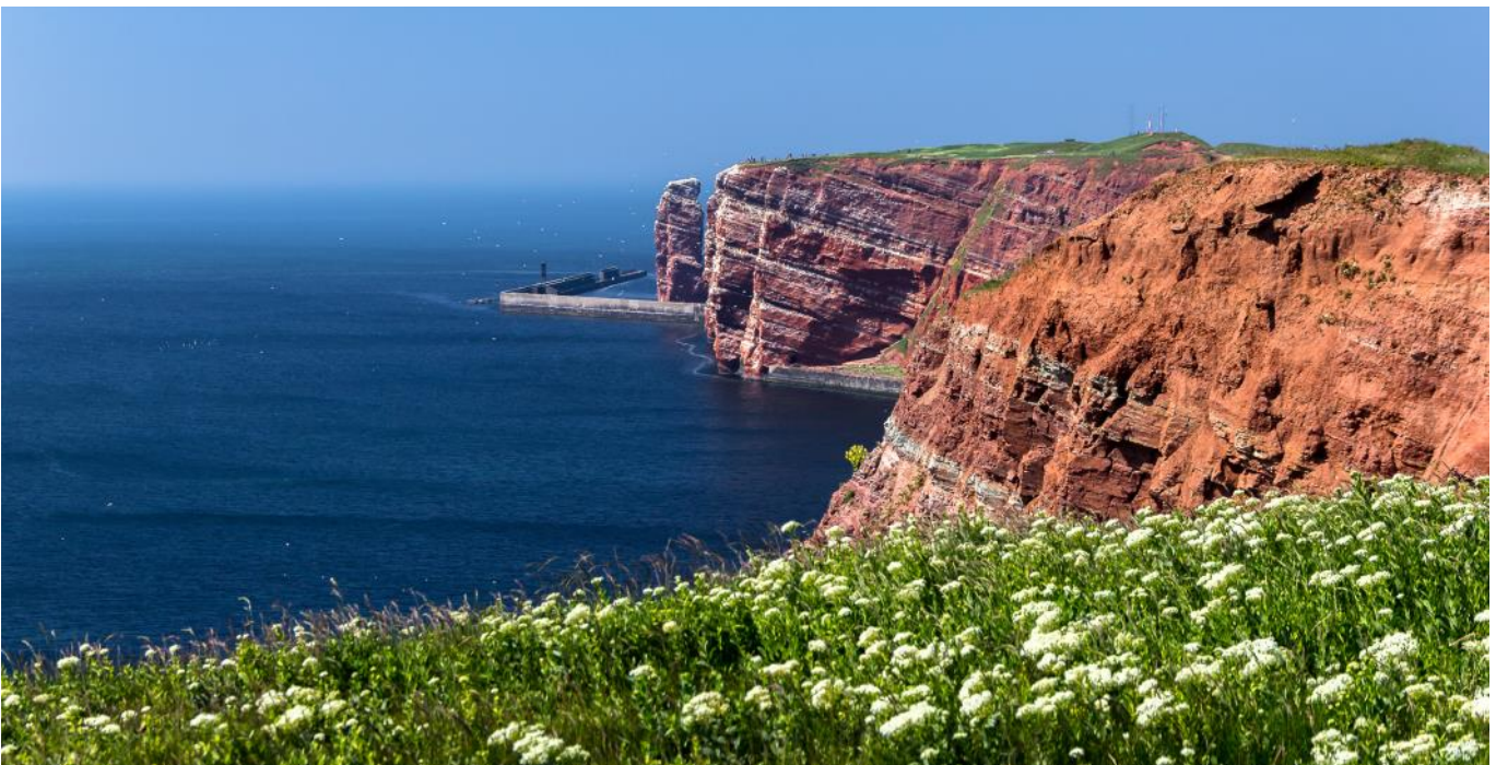
Strandklippor och rauken Långa Anna.

Helgolands Museum i Nordsjöhallen har visar öns historia, med tonvikt på konst, fotografi och litteratur samt kulturhistoria och därmed livet på ön, samt fossil och geologi.