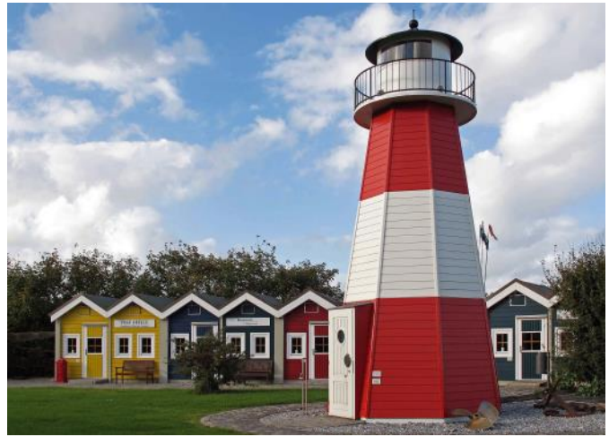
Hummerbodnar i Museitradgården.

Omkring år 1910 hade ön 2300 invånare (av frisisk härkomst) och mottog under ”säsongen” (juni-sept) över 20000 badgäster, nu är invånarantalet ca 1500 men antalet turister runt 400000 vilket dock är en