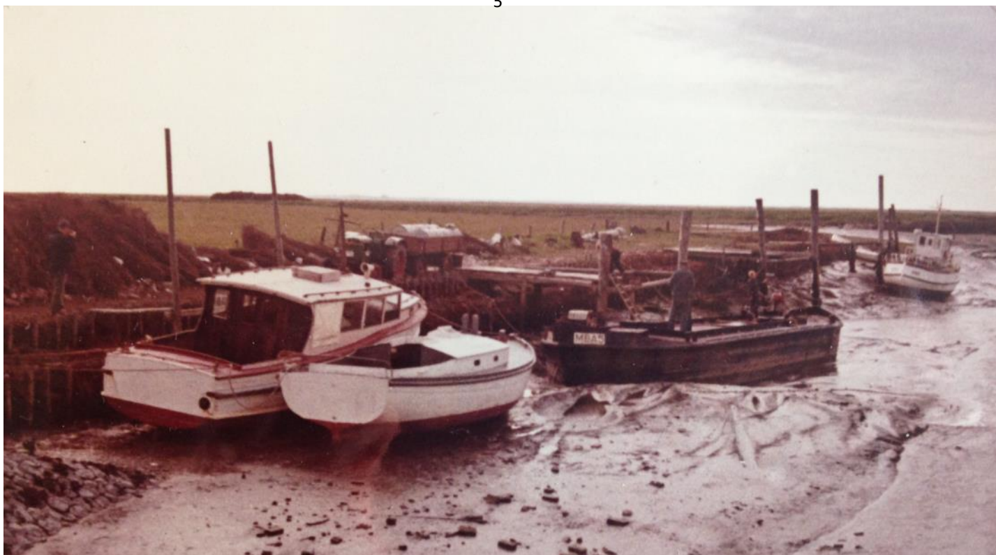
Hamnen på Hallig Hooge vid ebb.

stora staden Rungholt, och lämnat de ovan nämnda brunsskoningarna som nu ligger långt ut i havet. Kustlinjen ändrades och tusentals människor miste livet, stormen kallas med skäl för Den Store Manddrukning. I oktober 1634 kom Den Anden Store Manddrukning som bl a ödelade ön Strand, men i gengäld växte ön Skallingen fram.