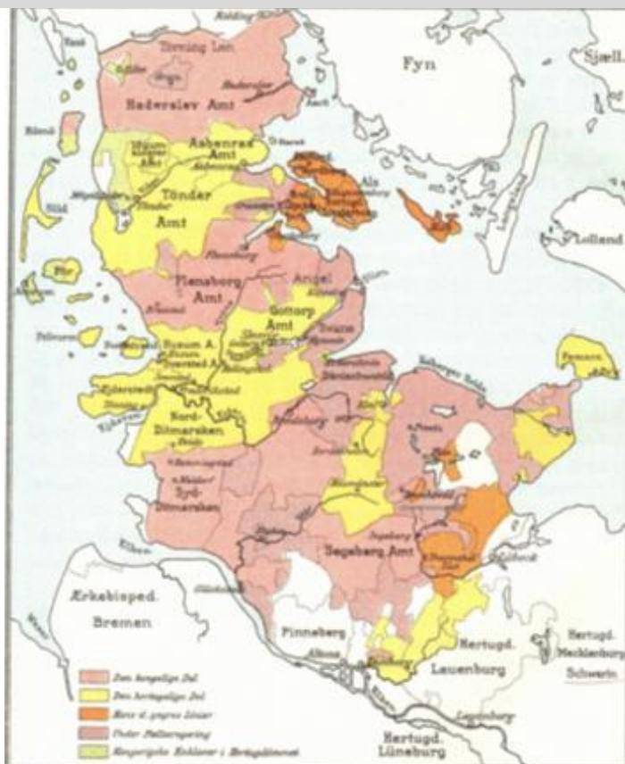
Karta 1. Sønderjylland och Holsten vid slutet av 1600-talet, uppdelat på områden som lydde under kungen, hertigar respektive kungens bröder, eller stod under gemensam regering samt några kungliga enklaver.

Även Sverige har haft ett finger med i maktspelen. En förbindelse mellan Sverige och Holsten uppstod redan under medeltiden. En av Valdemar Atterdags söner, Abel, gifte sig med grevedottern Mechtilde av Holsten, men efter att Abel stupat i ett fälttåg gifte hon om sig med Birger Jarl, vilket lär ha varit ett led i hennes egen