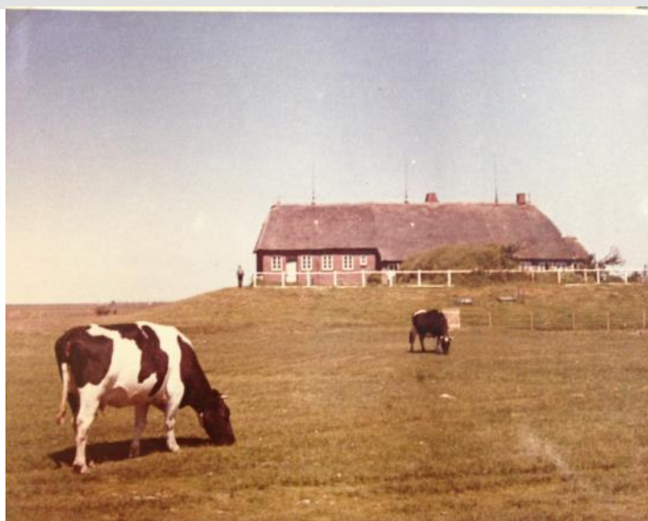
Hallig Hooge. Hus på "warft", kulle, för att minska utsattbeten för översvämningar.