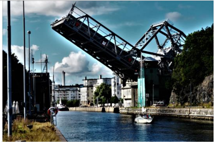
Danviksbron öppnas för sjötrafik.

Strandpromenaden slutar i Kvarnholmsparken, en liten grön oas mitt all betong. Här blev vi lite upp-