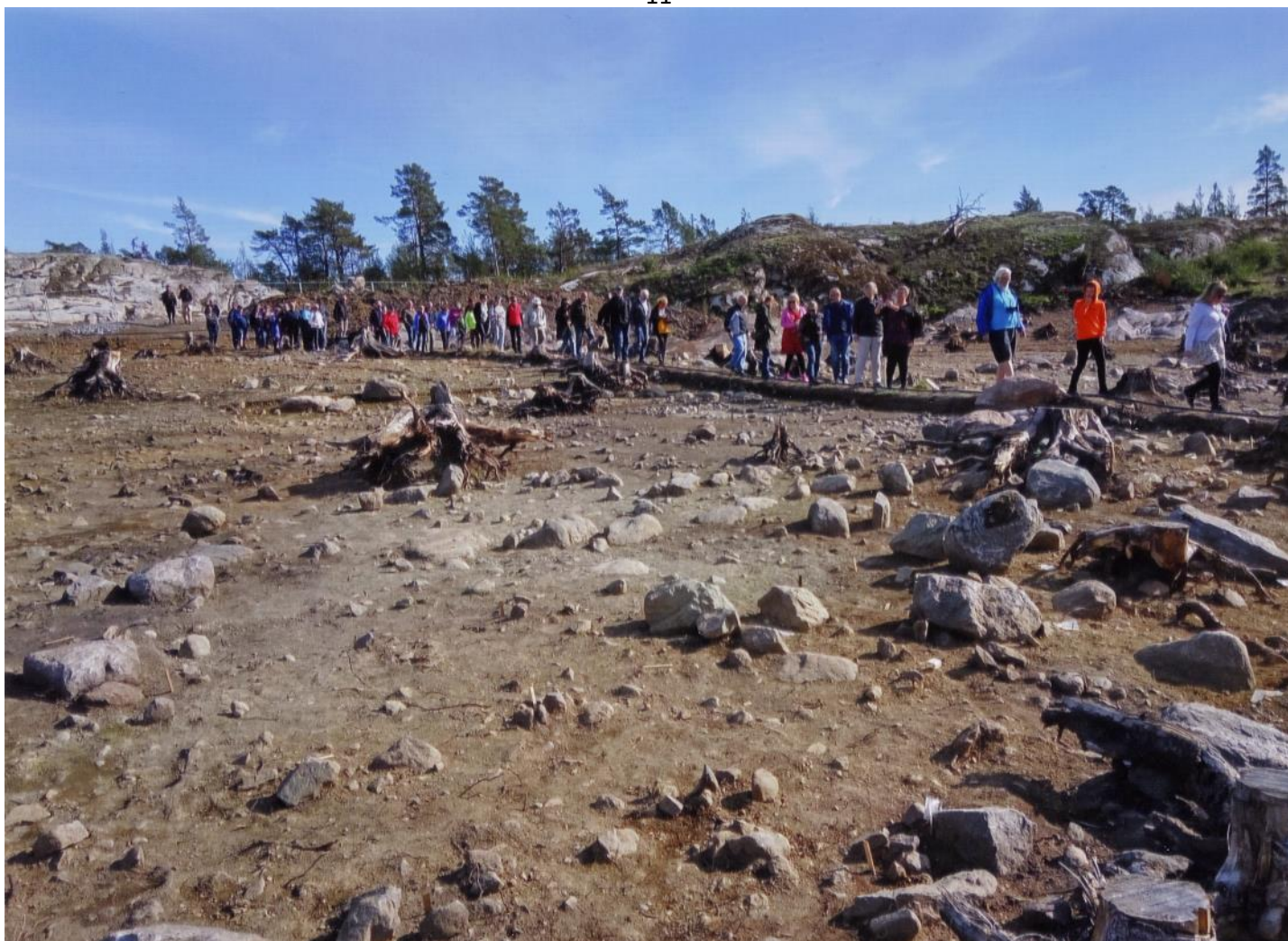
Gropkeramisk boplats (ca 4500 år gammal), upptäckt vid exploatering för den nya storhamnen i Norvik nära Nynäshamn, utgrävd maj-november 2018. Nu järnväg.