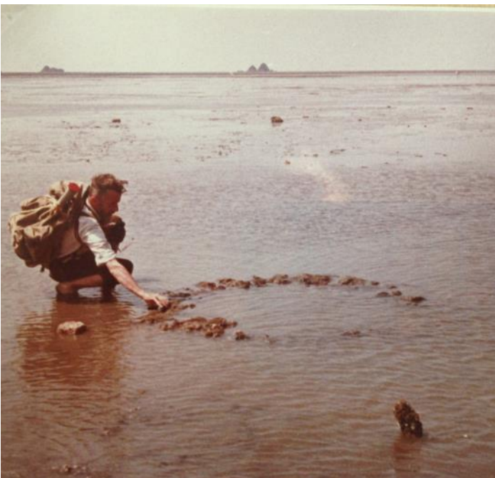
Medeltida brunn långt utanför den nuvarande kusten, synlig vid ebb.

Ute i Tyska bukten ligger ön Helgoland, som behandlas i en separat artikel (s 6-7). För mer än 50 år sedan, sommaren 1968, var jag ett par veckor på den lilla nordfrisiska ön Hallig Hooge. Min far deltog i en nordisk kurs, anordnad av Kristinebergs marinbiologiska station (nu Kristinebergs Marina Forskningsstation), som var förlagd dit. Jag reste med och följde med på