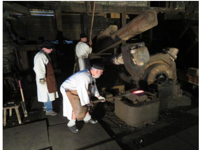
Några gånger per år ordnas visning av vallonsmide i 1700-tals smedjan vid Österbybruk.