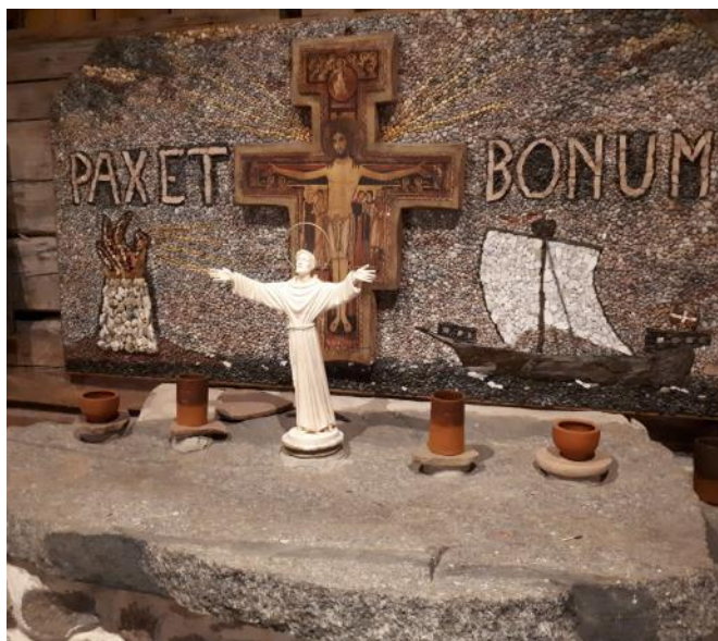
Franciskus. Pax et bonum—pilgrimers hälsningsfras.