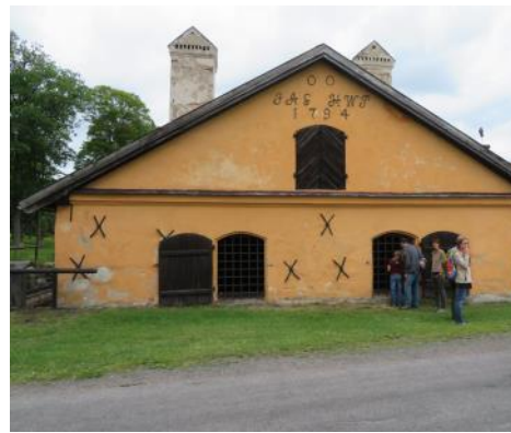
Smedjan i Österbybruk.