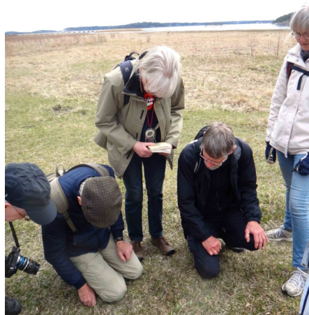
Även den minsta lilla rara blomma upptäcktes av Sandemar-deltagarnas skarpa blickar.