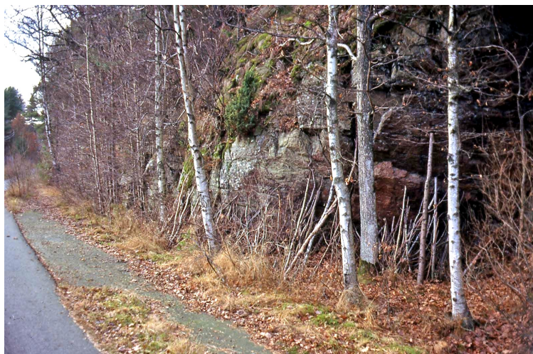
Stötteberget söder om Alingsås, Västergötland

Det sägs nämligen om en del rösen längs kusten, i fjällen och inte minst på Gotland (kallvarp) att "kastandet" skulle bringa lycka och välgång på färden. Men även här kan ursprunget mycket väl ha varit skyddet mot gengångare, alltså med en apotropeisk avsikt. Till exempel Hyltén-Cavallius skriver skulle "denna handling af fromhet, öfvad mot en afliden.... att han icke såsom gengångare må ofreda dem som färdas vägen fram." Kanske skedde förändringen när man ville undvika att man själv drabbades av samma öde som den döde som var anledning till kastet. Det var nog en naturlig förändring, även om man kände till den ursprungliga innebörden. Skall man ge den en relevant term kan man säga att det skedde som en profylaktisk , förebyggande, handling.