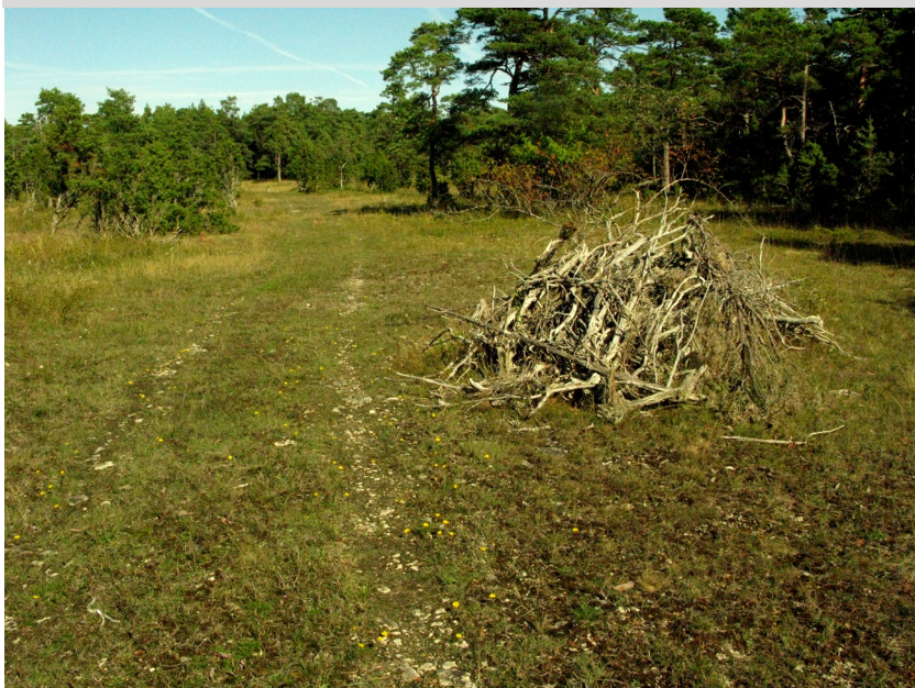
"Kallvarp" på nordvästra Gotland (Hall-Hangvar)