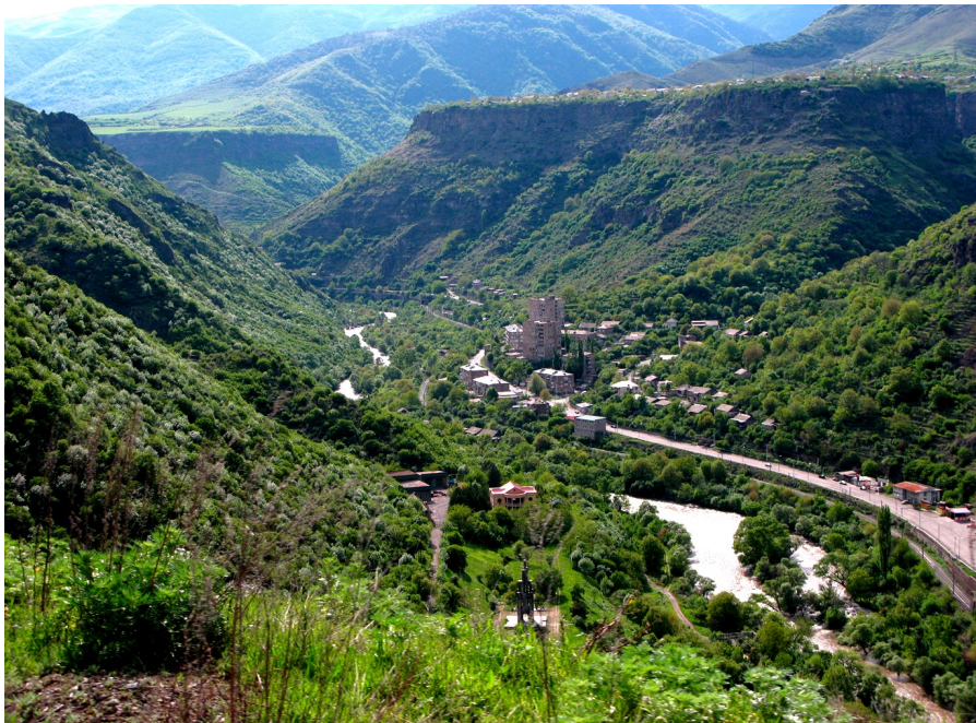
Dramatisk natur och en intressant geologi finner man överallt i bergen som dock är något tusental meter lägre än Ararat.

kallas i assyriska källor från det främsta fiendehållet Uruatri eller Urartu. Det behövs inte mycket fantasi för att inse att det är samma namn som berget Ararat. Men riket omfattade i sin kärna landen kring de stora sjöarna i Kaukasus och dess närhet, Sevan (nu Armenien), Van (Turkiet) och Urmia (Iran). Det nutida Armenien var en utkant i detta rike. Men före 700 f.Kr. uppförde dess kung Argishti i Urartu flera fästningar och städer där. Den mest kända borgen hette Eribuni och ligger restaurerad på en markerad kulle i nuvarande Jerevan. Inte heller där bör man tveka om likheten med stadens nuvarande namn. Från denna överflyttade man senare funktionen fästning till en annan kulle i närheten av en flod i staden, kallas Karmir Blur (Röda kullen). Den kallades Teschebaini efter en viktig gudom. Vi vet inte vad för språk man talade. Armeniskan är ett avlägset men indoeuropeiskt språk. Men i området kan också ha talats något av de kaukasiska språk, för vilka georgiskan är den viktigaste exponenten. Dessa språk är unika och räknas inte som indoeuropeiska. Urartu-riket upphörde vid den