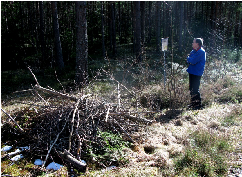
Platsen för rånmordet 1710 på väg mot Kristinehamn, Värmland.