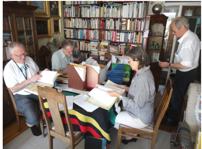
FNSiNs arkivgrupp sorterar fram det viktigaste ur föreningens historia som ska överlämnas till Stadsarkivet.