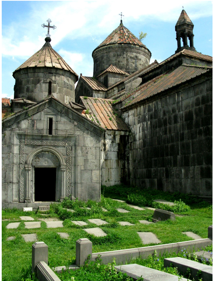
Många äldre stenkyrkor och kloster utgör omistliga kulturminnen överallt i Armenien. Här Haghpats kloster, utnämnt till världsarv av Unesco.

Liksom de judiska emigranterna har de armeniska betytt mycket för respektive stat. Rika magnater inom båda grupperna har donerat kolossala summor för byggnadsverk, konst, museer, institutioner för högre undervisning med mera. Mindre bemedlade bidrar på andra sätt. Men de största turistströmmarna till Armenien och Israel utgörs ännu av armenier och judar i förskingringen. Armenier känns igen på deras karakteristiska efternamn på -ian, -ijan, som i Chatjaturjan, Petrosjan, i fallet Paradjanov på ryska tiden utökat med -ov, en rysk ändelse, etc. Man vårdar i båda fallen de båda speciella språken i familjerna ute i världen- i judarnas fall inte bara hebre-