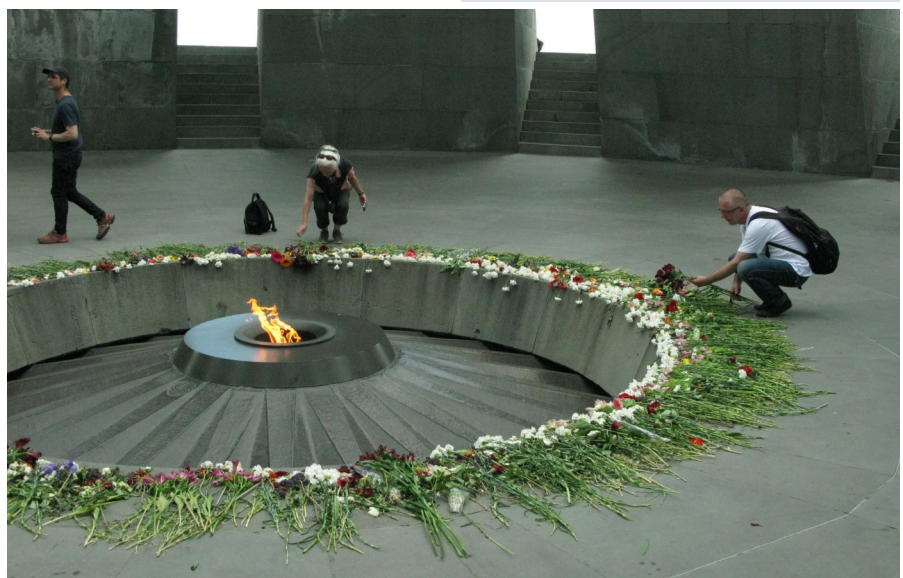
Monumentets eviga låga till minne av folkmordet på armenierna på Tsitsernakaberd, Svalornas fästning i Jerevan.