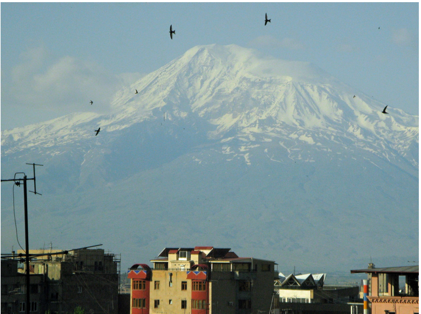
Retfullt avtecknar sig Ararats dryga 5000 m överallt i huvudstaden Jerevan, fast från andra sidan gränsen till den stora grannen Turkiet.

Den stora symbolen för armenierna är berget Ararat. Man kan bland armenier ibland trösta sig med att i det stora område som utgjorde Stor-Armenien under medeltiden fanns en av de större civilisationerna i Mellan-Östern redan 1200 år f.Kr. Detta rike