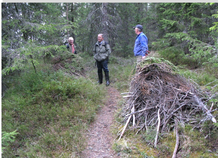
Två offerkast vid pilgrimsstigen i Trysil, Norge