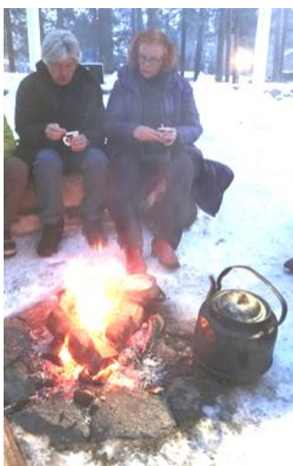
I snön utanför Ajtte bjöds det på kockaffe över öppen eld. Det tyckte vi var trevligt.