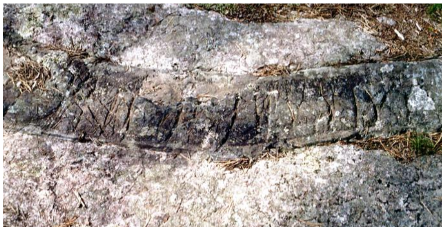
Bild 4. Runamobällen med den förmodade runristningen

framkom det bl.a. till slut, att lokalbefolkning kände till flera diabasgångar med runliknande sprickor i trakten. Runstenar fanns ej när vägens gravar anlades, trots att runstenar med urnordiska runor är fler i lilla Blekinge än i något annat landskap. Den ståtligaste av dem alla står vid Björketorp några kilometer bort. På kung Valdemars och Saxos tid var runstenstiden över. Det är inte konstigt med intresset för hällen, då vägen går direkt över diabasgången. Alldeles intill står dessutom en av de här beskrivna blocken på underliggare, som man förr trodde var en offersten. Det har föreslagits att det kanske är platsen själv som är viktig, att Runamo är en uråldrig kultplats, som givit mystik åt de förmodade runorna. Runor var kända som tecken för hemlig kraft. De av danskarna påhittade runorna sades handla om det väldiga slaget vid Bråvalla hed ca år 750, omtalat i