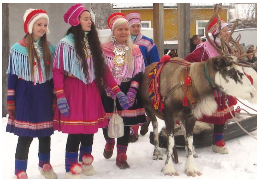
Yngre medlemmar ur familjen Kubmunen som utförde en traditionell renraid varje dag på snöscenen.