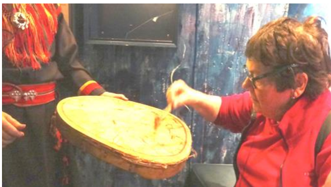
När vi gick på guidad tur i Ajtte, det stora samemuseet, fick några också prova på att trumma på en shamantrumma.