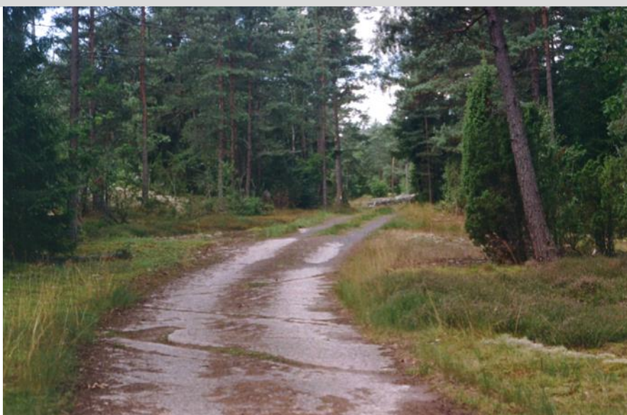
Bild 1. Vägen före stigen

Sommaren 1984 hände något unikt när jag inventerade längs Nyköpingsån, norr om staden, nära de senare upptäckta, likaså unika bronsåldersristningarna vid Oppeby. Genom gravfälten både söder och norr om ån leder en halv väg ner i ån. Just vid detta tillfälle hade man sänkt, nästan tömt, ån på vatten. Ingen tillfrågad Ortsbo hade någonsin upplevt detta tidigare. Vid halvvägen söder om ån står två vikingatida