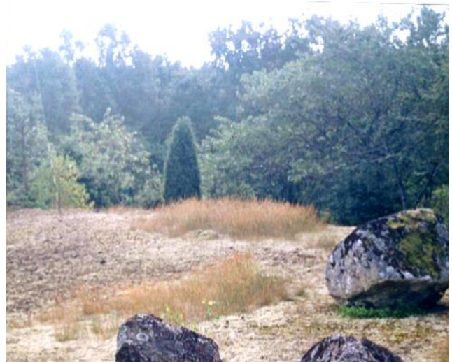
Bild 2 Grästuvan hitom enbusken är den första stensättningen.

När man lämnar bygden i Hoby vidtar ett långt, flackt men högt beläget område med plana granithällar, flera kilometer där vägen slingrar sig fram. Efter någon kilometer dyker två forngravar upp på en håll. Först en liten, rund och flack stensättning med högt gräs i mitten (bild 2), för de flesta bara en naturlig tuva. Denna grav var en av de fyra undersökta år 1972, av alla 18. Den var uppbyggd av små stenar samt grus och sand, 5 cm ner uppblandad med träkol och sot. Direkt på