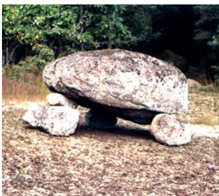
Bild 3 Den första offerstenen.