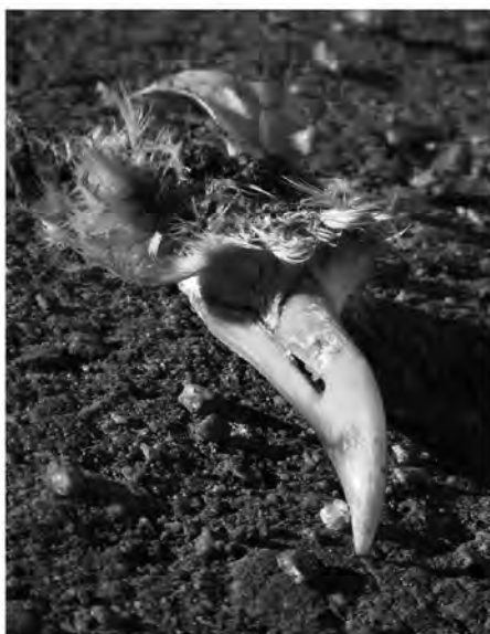
Hur mäs det? Endast näbben och lite fjädrar fanns kvar