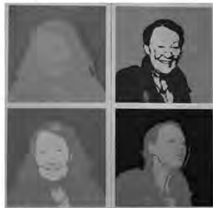
Bild med selfie i fyrtal - ordföranden var där

Den senaste utställningen handlade om arvet efter Andy Warhol. Var det han som uppfann selfien? I utställningens fotoautomat kunde man ta bilder på sig själv helt i Warhols anda.