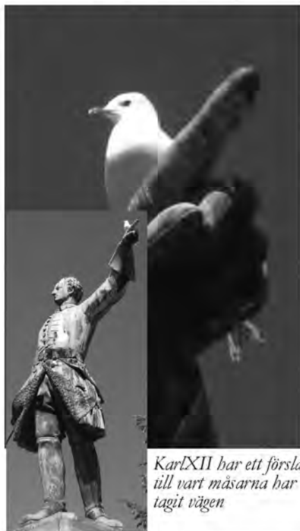
Karl XII har ett förslag till vart måsarna har tagit vägen