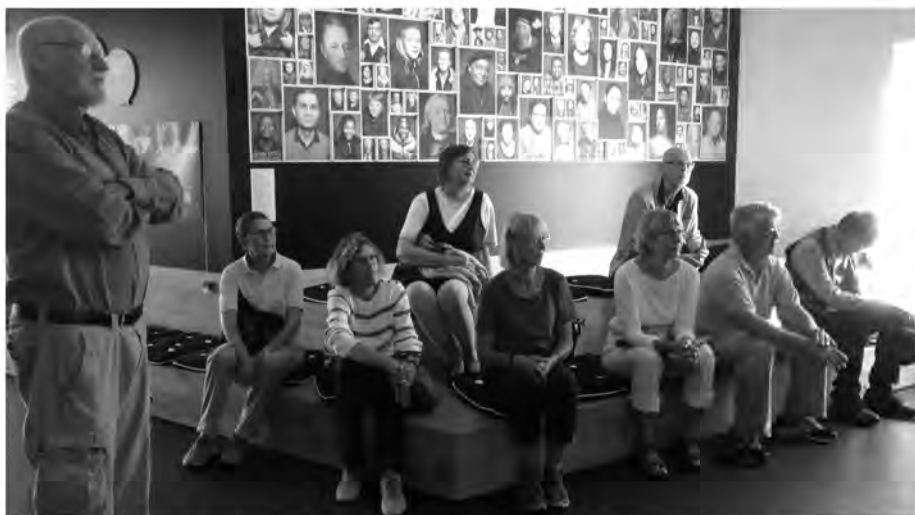
Ett gäng "FNSiN-veteraner" besökte nyligen Slagfältsmuseet