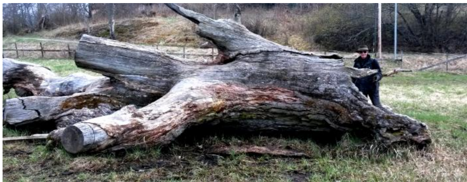
Gammeleken vid Viggbyholm.