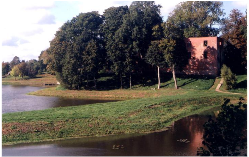
Borgruinen i Grobin.

flat mark är utan alternativ gotländska. I högarna är främst män, oftast med vapen, begravda, betydligt färre kvinnor. De gotländska gravarna är oftare kvinnogravar än i högarna, även barn finns. Männens gravar innehåller sällan vapen. Kvinnornas gravgåvor är nästan bara tillverkade på Got-