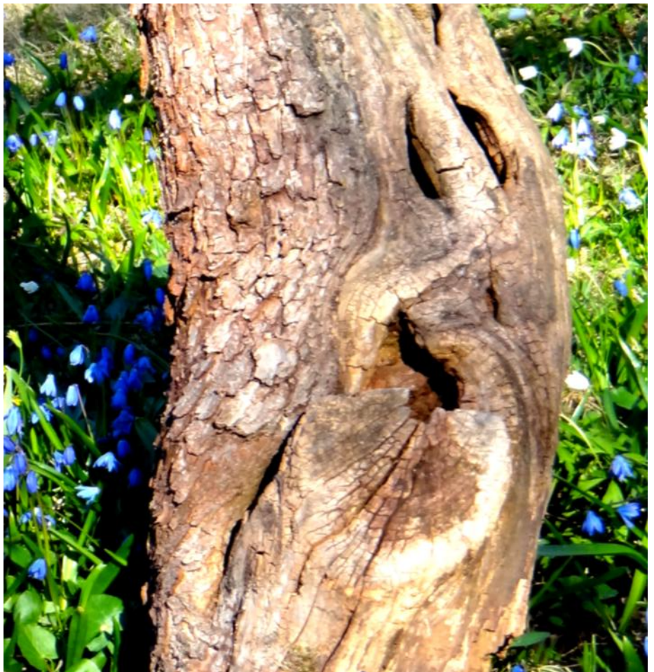
Det glada päronträdets i min trädgård.