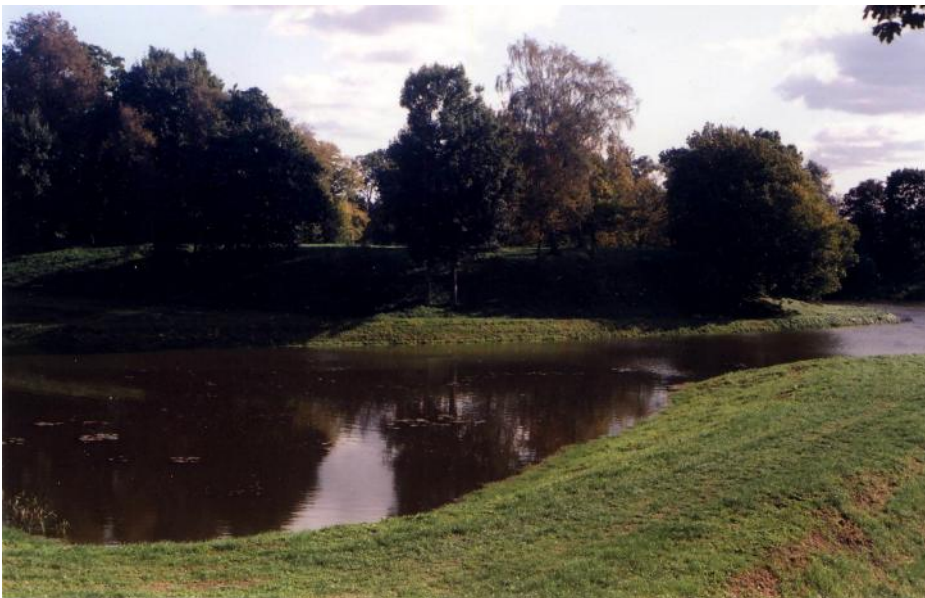
Fornborgsudden i Grobin i bakgrunden, med "hamnbassäng" bitom den. Till vänster om fotografen utanför bilden står en medeltida borgruin.

svearna sina skepp för att anfalla ännu en "kurort", som hette Apulia (enligt Rimbert). Staden är numera en liten by, som ligger 4-5 mil sydöst om Grobin, vid källorna till floden Barta, som rinner ner i Liepajasjön, liksom den mindre Alandeån från Grobin. Byn ligger i Litauen, utanför staden Skuodas, alldeles intill gränsen mot Lettland. Vad kan då Apulia heta idag, nästan 1200 år senare? Jo, Apuole, känd för att ha en av Baltikums mäktigaste fornborgar, av jord och sand som borgen i Grobin. Givetvis är då Grobin identiskt med Seeburg. Att Apuole är identiskt med Apulia kan ju inte betvivlas. Det tog vikingarna fem dagar att marschera till Apulia.