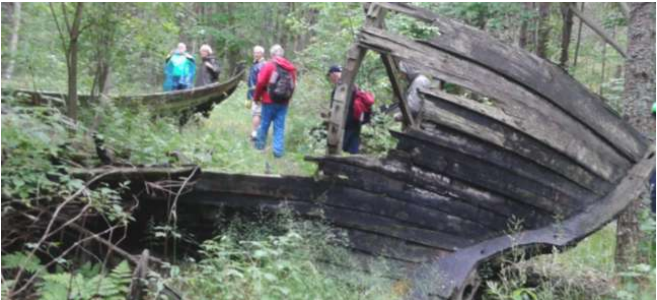
Båt kyrkogården i Mazirbe

http://www.latvia.travel/en/sight/white-dune-purciems www.latvia.travel