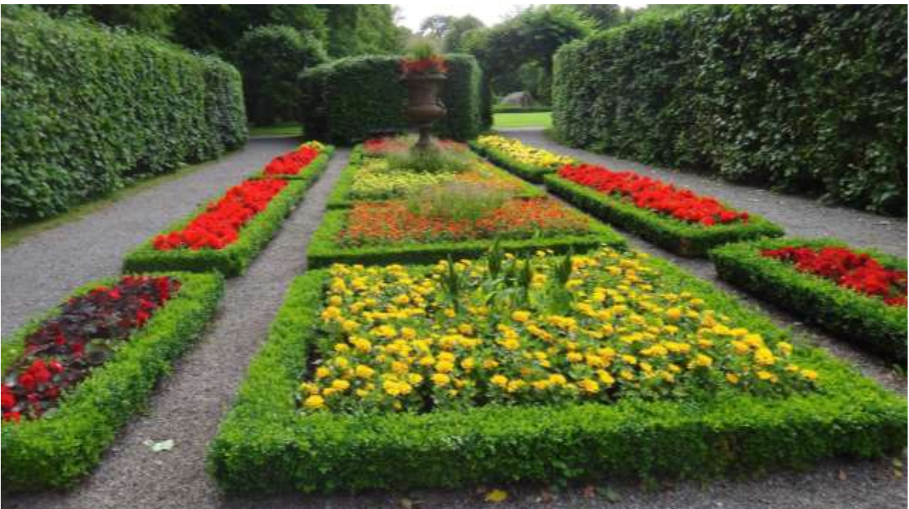
Ulriksdals slottspark—en del av Nationalstadsparken