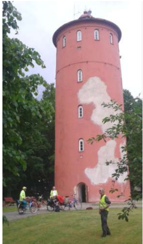
Fyren i Slitere