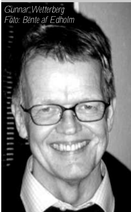
Gunnar Wetterberg