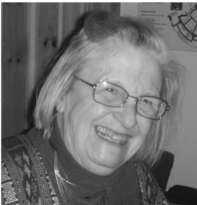
Ekonomipristagare Elinor Ostrom

Vår medlemstidning NOS har i år klarat 30 års utgivning och det är väl också värt att fira! Varför inte med ett tårtkalas redan nu den 25 januari 2010. Se i programmet .