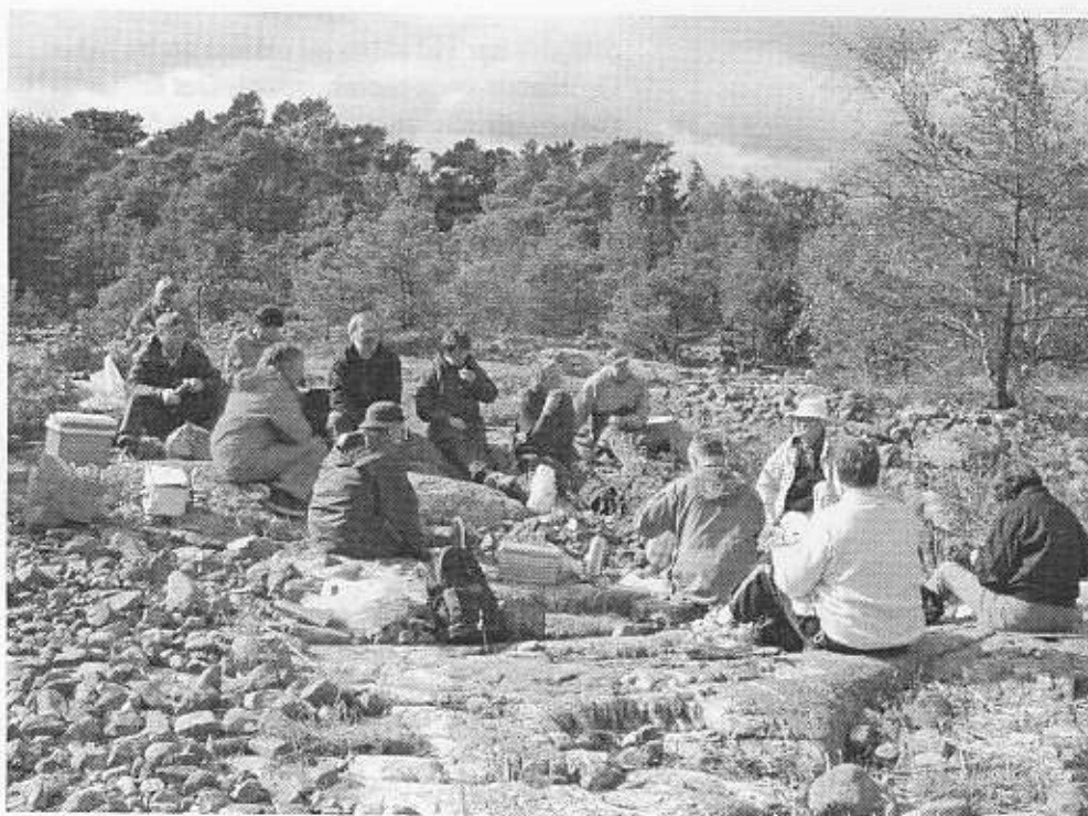
Havtornspicknick, hösten 2002.

Upplysningar: Erik Elvers 08-85 84 88 (b), e-postadress e.elvers@bredband.net . Anders Schærström tfn 08-758 30 03 (b), e-post: anders.schaerstrom@delta.telenordia.se .