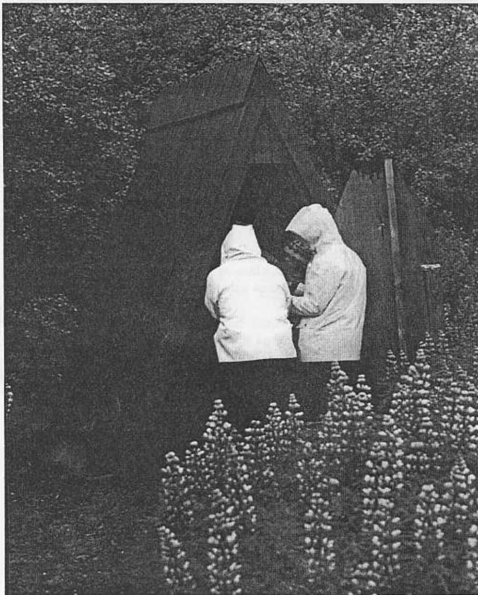
Blåa lupiner på Island.

– Se på alla spovar som flyger här uppe, säger Sigvardi. Egentligen hör de hemma på sankmarken nere på slätten, men numera håller de gärna till på höglandet om det finns lupiner. Bland rötterna hittar fåglarna mask och de täta bestånden ger ungarna skydd mot rovfågel och fjällräv.