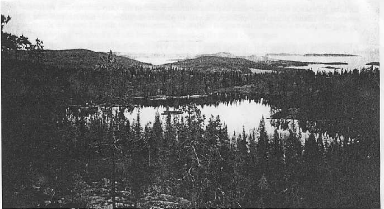
Utsikt Höga kusten.