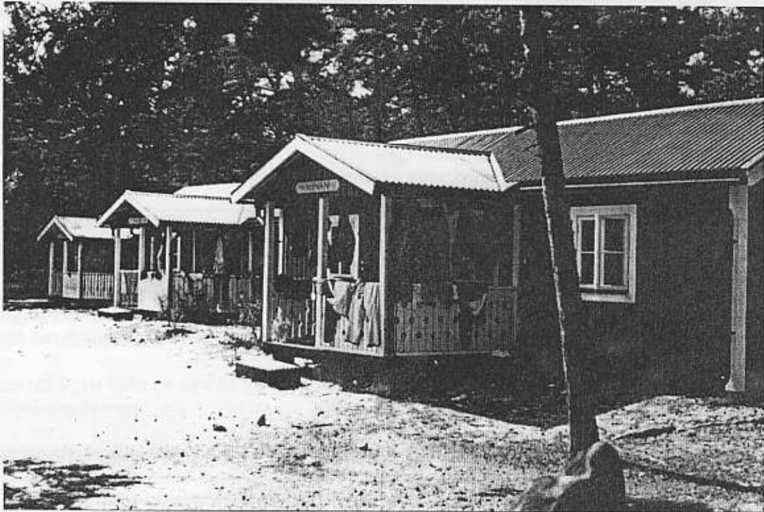
Sovsäckar på tork, Gotska sandön.

Väl framme på Sandön gick vi iland nära Båthuset och snart såg man en betydande samling sovsäckar hängande på tork på Lägerplatsen. Ett fåtal dagsresenärer stapplade omkring på ön under de fyra timmar det tar för båten att gå vidare till Fårösund och tillbaka, förmodligen emotseende hemresan utan entusiasm.