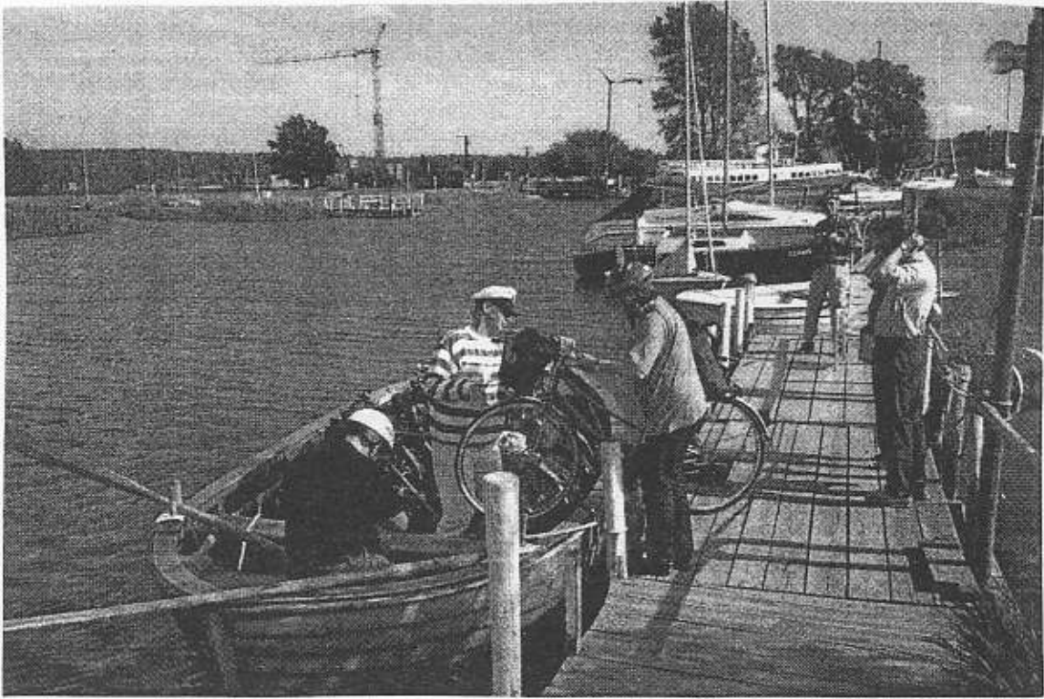
Roddfärja med cyklar från Moritzdorf

Cykelvägarna är av mycket skiftande kvalitet. Man kan trampa i lugn och ro på idylliska småvägar, lyssna på fågelkvittret och andas in försommarens ljuvliga dofter men däremot på andra ställen göra sig så liten som möjligt i utkanten av stora leder med tät biltrafik. Det finns vägar som är belagda med ungefär meterlånga betongblock vilka fogats samman utan några nämnvärda krav på precision med påföljd att cyklingen blir en mycket stötig upplevelse. Vi fick vara med om utsökt cykling längs sydöstra stranden - Lauterbach-Göhren samt sträckan Lauterbach-Garz-Bergen-Putbus (delvis på en gammal banvall).