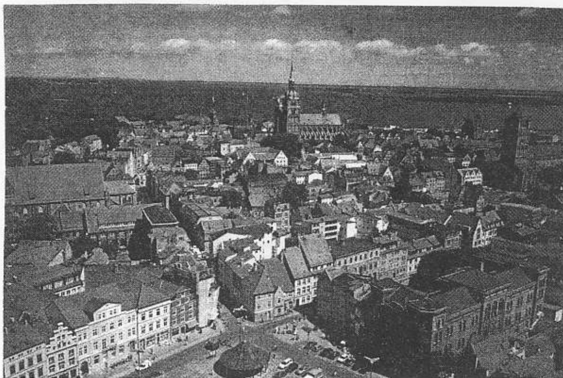
Vy över Stralsund från tornet i Mariakyrken

Många är vi väl som färdats med tåg mellan Malmö och Berlin och på vägen sett Stralsunds stadssilhuett med dess vackra torn och undrat vad det var för stad. Under DDR-tiden gick det knappast att besöka staden, men sedan Tysklands återförening är det betydligt enklare och smidigare.