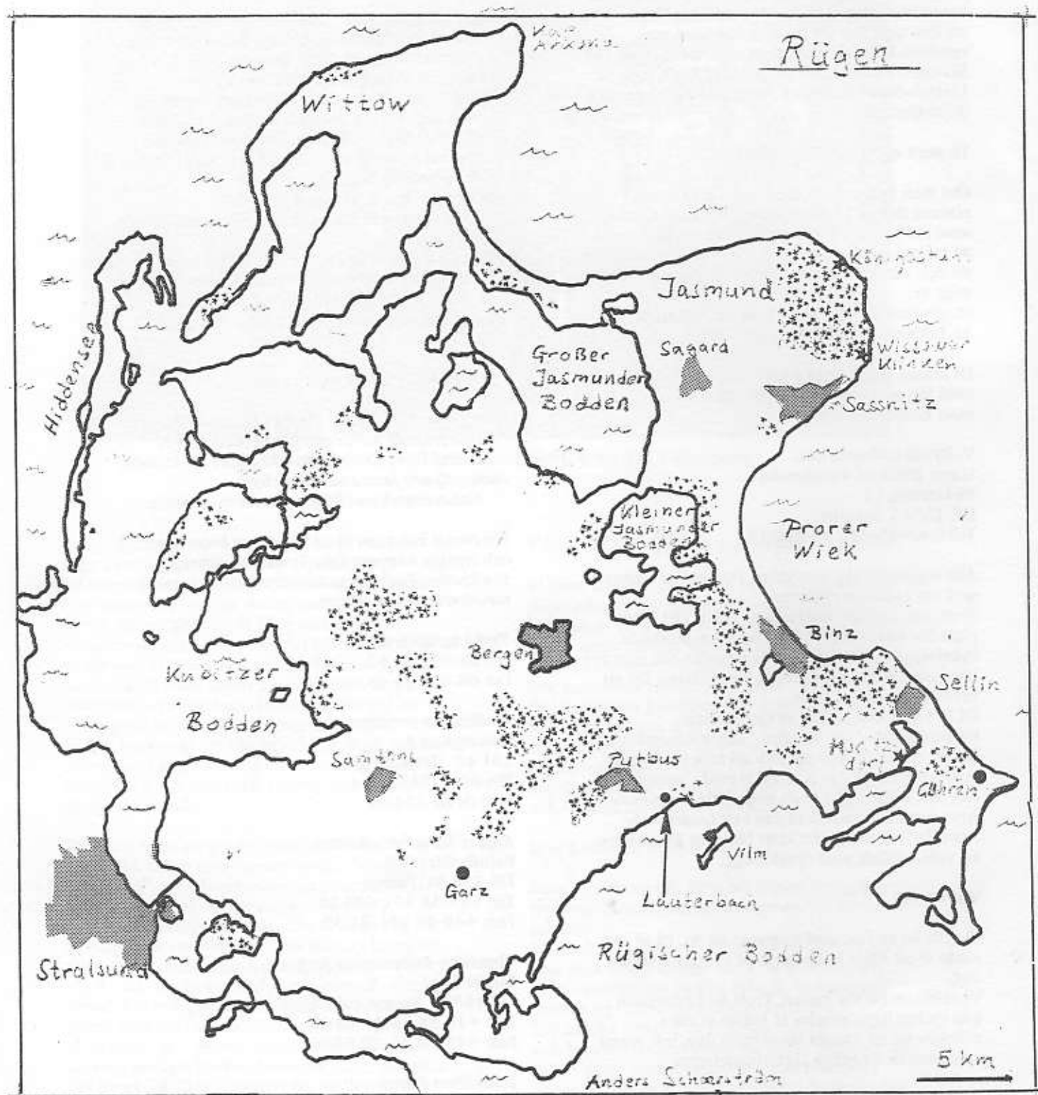
Karta över Rügen, ritad av Anders Schierström