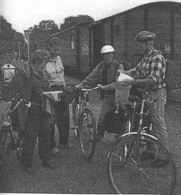
"Der rasende Roland"

Jag själv tog med mig min egen cykel, medan de andra valde att hyra cyklar på Rügen. Dessa val föregicks av åtskilligt funderande för och emot det ena och det andra. Vågar man ta med en egen cykel? Kan man vara säker på att komma över bra hyrcyklar? Birgitta och Kaj stannade för mountain bikes, medan de andra nöjde sig med vanliga cyklar med färre växlar. Vi fick således testa olika sätt att ordna cykelturen på ön och de flesta av oss blev nöjda. Det gick relativt smidigt att ta med en egen cykel på färjan och hyrcyklarna var över lag mycket bra.