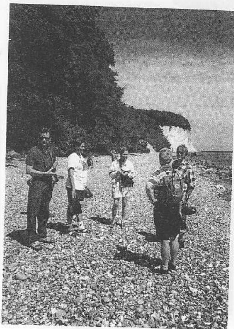
Jasmund nationalpark

Den rena jordbruksbygden blandas med lövskogar - i synnerhet bokskogar men med talrika ekar, lönnar, alar, askar, almar, och inslag av björk. Murgröna växer på en del trädstammar och förstärker det lummiga intrycket. Fläder växer ymnigt, på sina ställen i hela dungar och i juni ligger doften från de vita blommorna tung över nejden. Björnbärsbuskarna bildar vidsträckt snår och man får lust att återvända framåt augusti-september när bären är mogna. Pilevallar och pilealléer påminner om Skåne. På en del ställen såg vi riktigt kraftiga enskilda exemplar av pilar. På fälten lyste det av rött av vallmo, blått av blåklint och blåeld. Gult av blommande ginst vid vägkanterna kompletterade färgprakten. Vid badstranden i Göhren noterade vi en gammal bekant, nämligen havtorn!