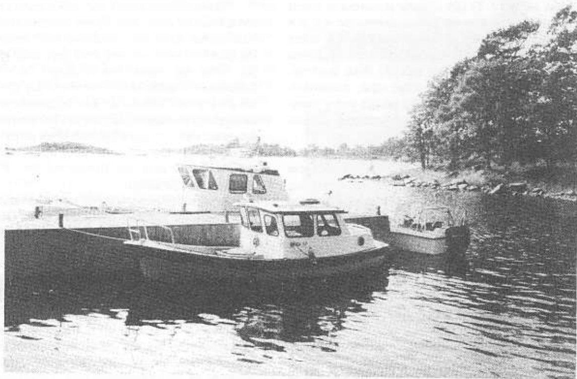
I skyddad hamn. Från Arkösundsexkursionen.

Jag läste nyligen en bok om det indianska kulturella inflytandet i Amerika där ett kapitel behandlar just ortnamn. Författaren skriver att indianerna ofta använde djurnamn när de skapade ortnamn, och hävdar att de europeiska bosättarna tog upp denna namngivningsgrund och att sådana namn blev långt vanligare bland dem än