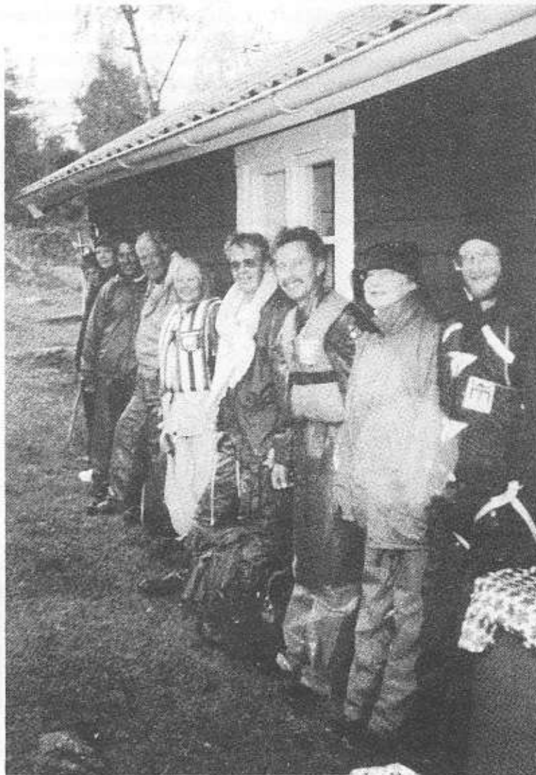
Arkösundsgruppen i regnskydd.