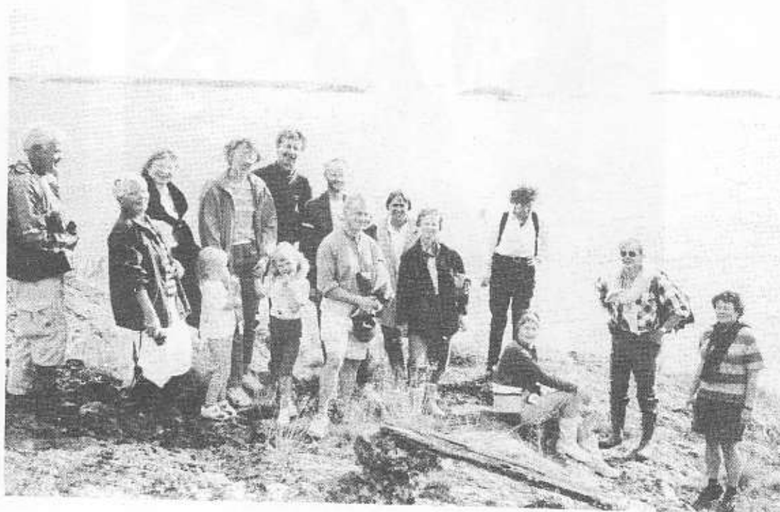
FNSiN i Arkösunds skärgård.

2) räkningen är som sagt rent mekanisk. De båda förekomsterna i Östergötland, Stora Renemo och Renstad, kan på goda grunder antas inte syfta på djuret.