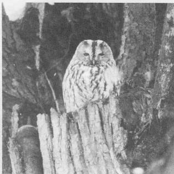
Ho-ho! Kattuggla i Ulriksdals slottspark (blivande Eko-park?), februari 1988.

teborg) och en för mera mångsidiga mål (FNSiN). Det blev för övrigt ytterligare en splittring. Lundasektionen (om man får kalla den så), blev en tredje avlägg, bl a på grund av grundläggande meningskiljaktigheter om politiska ståndpunkter. Vi inom FNSiN ansåg det viktigt att att föreningarna bibehöll sitt engagemang i samhällsfrågor. De