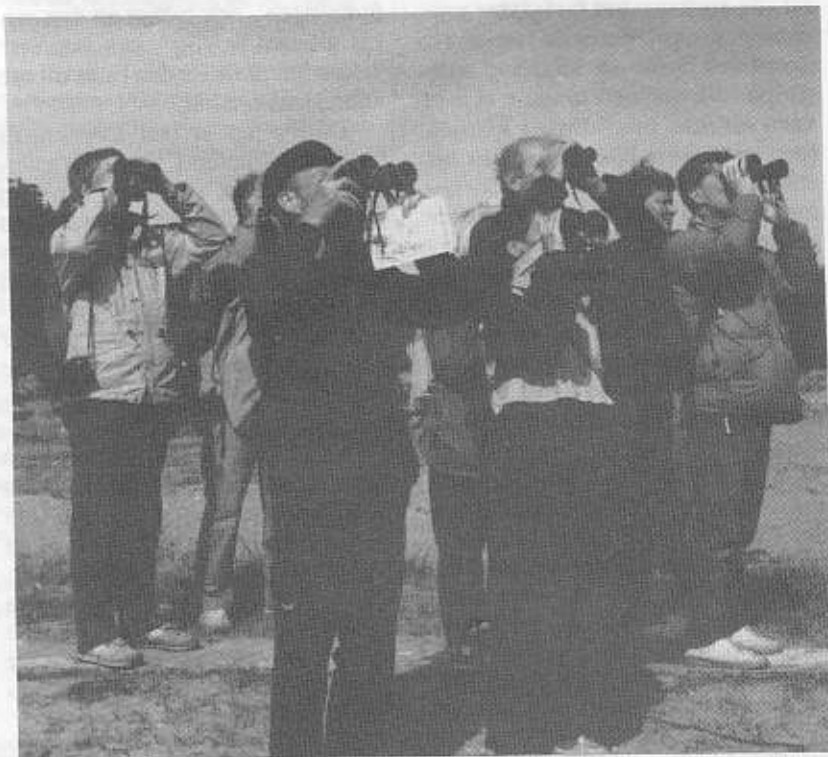
FNSiN-medlemmar som skådar in i framtiden? Nej, de tittar efter fåglar vid ett av FNSiNs besök på Gotska Sandön.

Det var så, att jag gick min första fjällvandring den sommaren. Två kamrater från Götene i Västergötland for upp för att möta mig igen i Umeå. Och det var inte vilket friluftsintrasse som helst (och följaktligen redan i föreningens anda). Vi var intresserade av grottor och skulle kolla kalkstråk i trakten av de stora sjöarna Ikis-, Mavas- och Pieskejaure. Det ståtliga mötet med dimmiga och smått hotande fjällväggar kom oss att fantisera om en viss vandring i Mordors mörka land, som just då var mycket aktuell (måhända är de små och obetydligas undanhållande av maktens farliga ringar alltid aktuellt). När vi så nått över norska gränsen vid Sulitelma kopparverk och