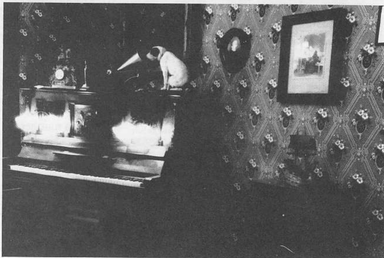
"His masters voice"

I östra Finland, centralt i sjöområdet mellan Nyslott och Kuopio, ligger staden Varkaus. Staden som med 25000 invånare är ungefär lika stor som Nyköping har en lång musikalisk tradition. Kanske är det ett skäl till att här finnes ett museum ägnat mekanisk musik.