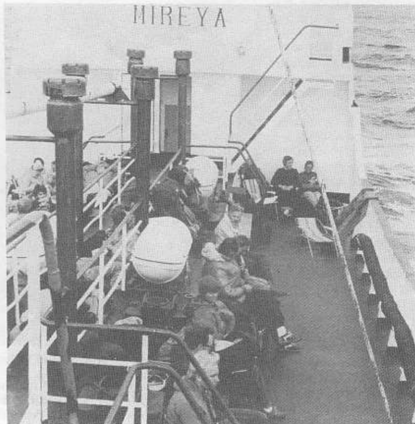
Mot Gotska Sandön.

Till mina starkaste minnen från föreningen hör det veckoslut då vi cyklade Roxen runt. Vi startade en lördagförmiddag i september från Linköping där vi hyrde våra (näja..) cyklar. Det var ganska mulet när vi gav oss iväg genom de linköpingska villakvarteren på väg ut mot de öst-