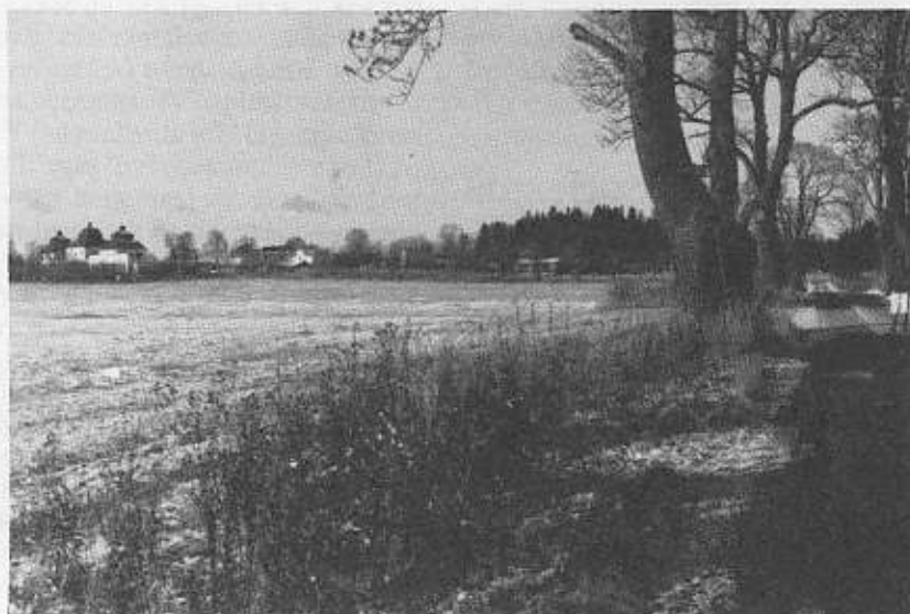
Allén vid Runga Herrgård, november 1987.