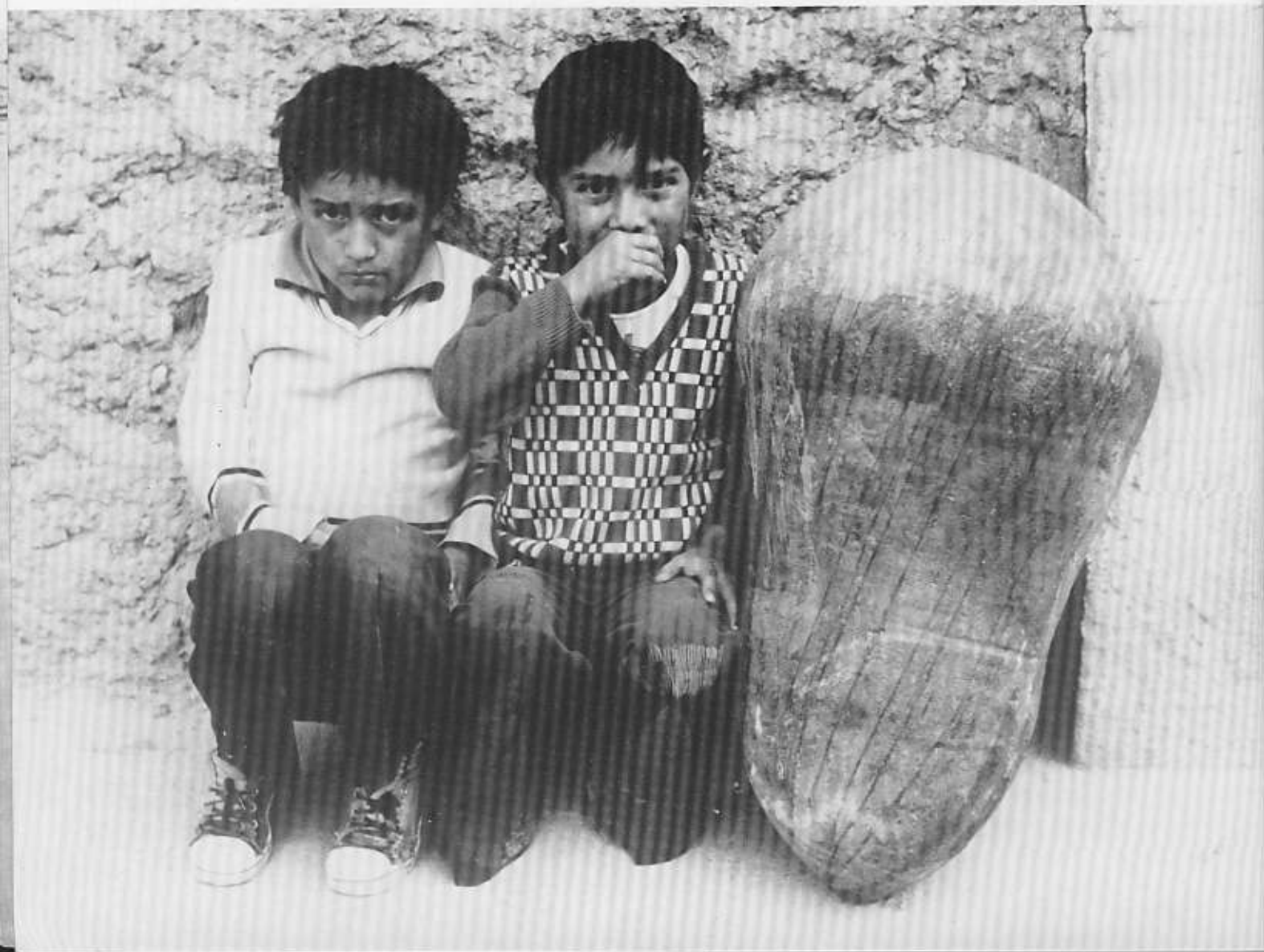
Amforan från San Miguel.

Tidigt nästa morgon lämnade vi San Miguel, eftersom vi fick möjligheten att rida på varsin mulåsa. Den steniga, leriga stigen följde den branta, djungelklädda dalsidan, som ofta stupade lodrätt ner mot Cuyesfloden, långt under oss. Vi skulle ideligen korsa små sidodalgångar med fors-